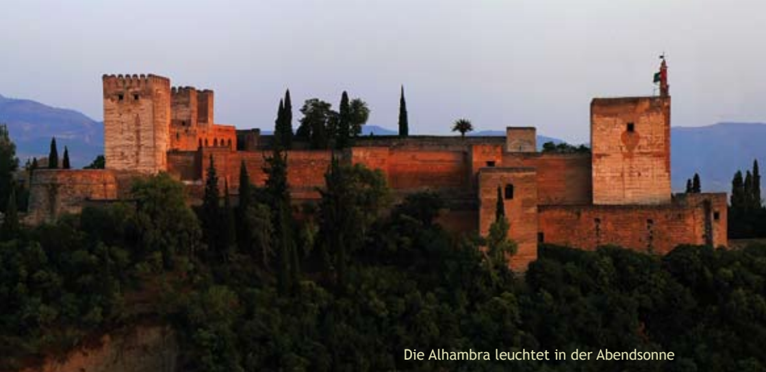
Die Alhambra leuchtet in der Abendsonne