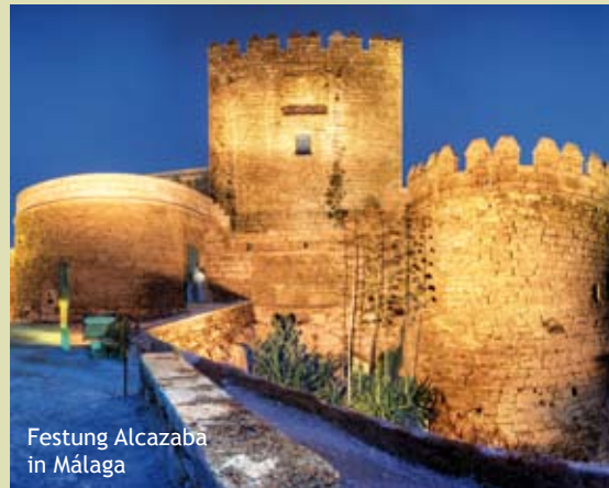
Festung Alcazaba in Málaga