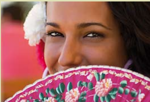
Plaza de Espana, Sevilla