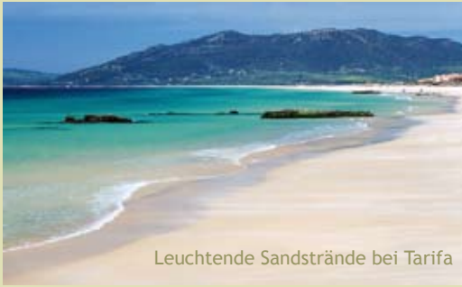
Leuchtende Sandstrände bei Tarifa

Wer hier Urlaub macht, sollte auch einen Ausflug nach Cádiz unternehmen. Die Handels-, Hafen- und Provinzhauptstadt fasziniert durch ihre unvergleichliche Lage und ihre bedeutende Vergangenheit: sie wurde im 11. Jh. v. Chr. von den Phöniziern gegründet und gilt als älteste Stadt Europas. Auf einem Felsplateau am Ende einer schmalen Landzunge gelegen, nennt man Cádiz auch „La Tacita de Plata“, „Silbertässchen“. Der Anblick dieser aus dem Atlantik aufsteigenden Festung in weißestem Weiß ist in der Tat überaus stimmungsvoll, vor allem im Licht der untergehenden Sonne.