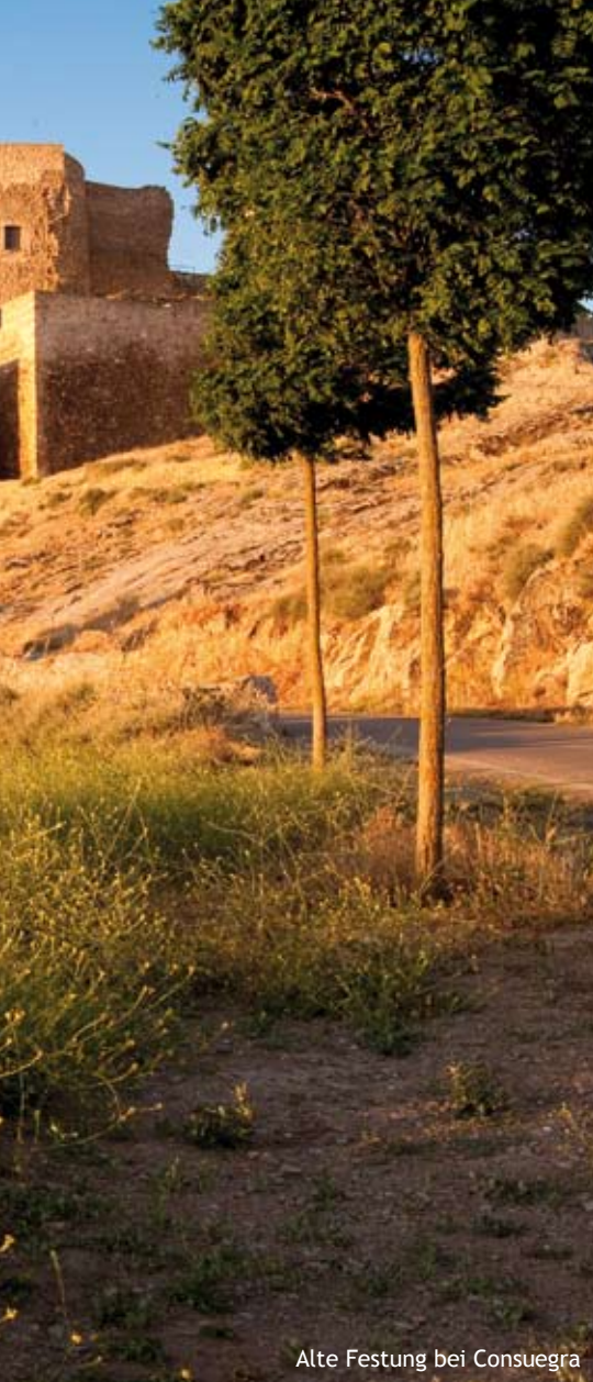
Alte Festung bei Consuegra

Die Sonnenküste umfasst die gesamte Mittelmeerküste der Provinzen Málaga und Cádiz. Sie ist wegen ihrer Naturschönheiten und ihrer Infrastruktur ein besonders attraktives Urlaubsziel, und das nicht nur bei deutschsprachigen Urlaubern. Prachtvolle Strände, stille kleine