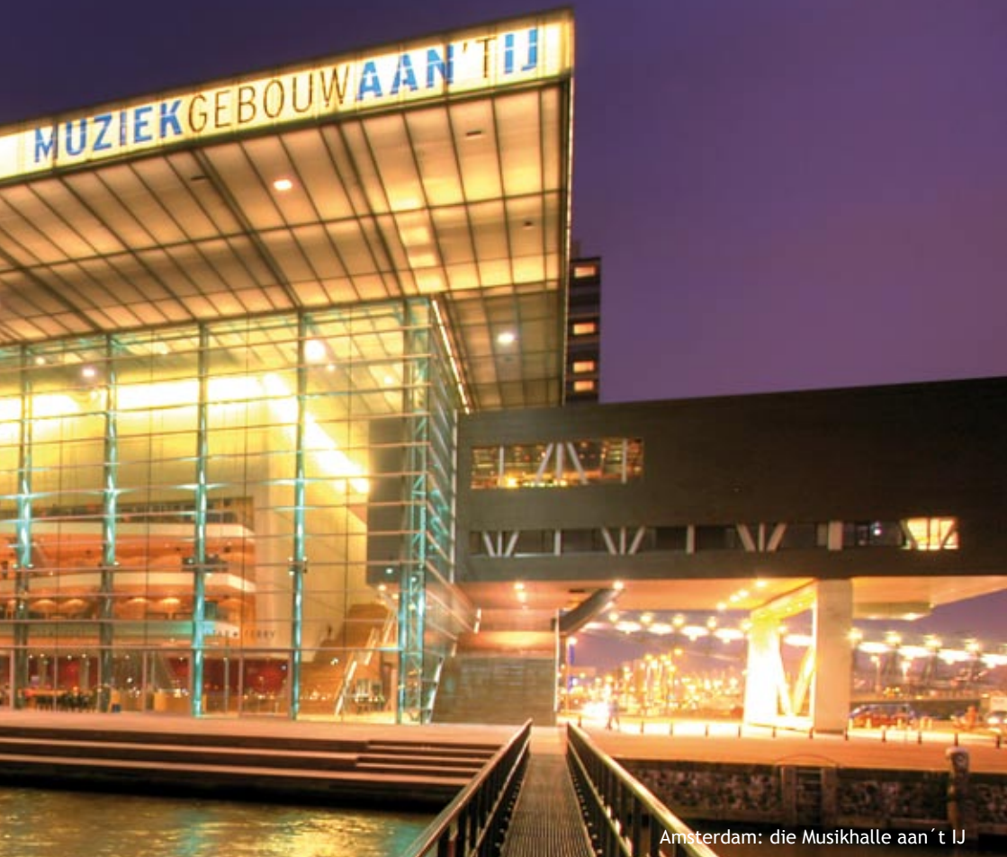
Amsterdam: die Musikhalle aan 't IJ

auf dem größten Blumenmarkt Europas genauso zu einem Aufenthalt in der holländischen Hauptstadt wie ein Spaziergang entlang von Szenelokalen und moderner Architektur.