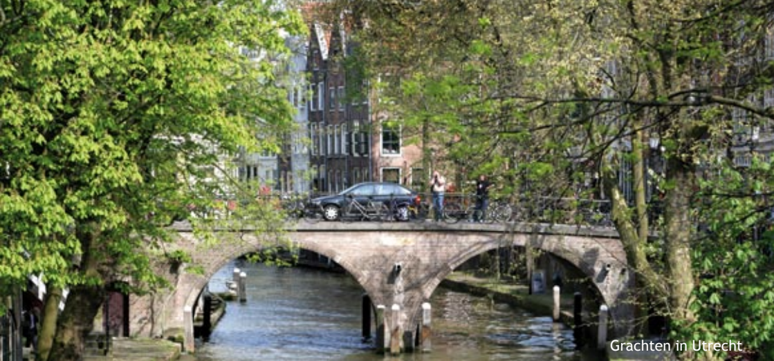
Grachten in Utrecht

Vermeers „Mädchen mit dem Perlenohrring“ täglich viele Besucher in seinen Bann.