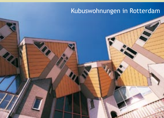
Kubuswohnungen in Rotterdam