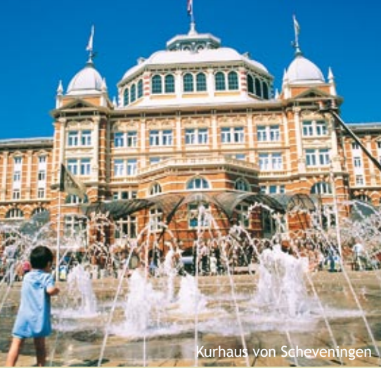
Kurhaus von Scheveningen